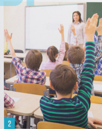
2 Happy Smile Profile

Công Ty TNHH Đào Tạo Và Tư Vấn Giáo Dục Happy Smile ra đời với mong muốn mang đến sự phát triển và thịnh vượng cho người Việt Nam. Chúng tôi luôn cố gắng tạo ra những sản phẩm, dịch vụ tốt nhất giúp người Việt tìm ra được tài năng và phát huy tối đa năng lực của mỗi cá nhân. Chúng tôi mang trên mình sứ mệnh chia sẻ trách nhiệm với cộng đồng thông qua việc đầu tư vào giáo dục, đầu tư vào tương lai, đầu tư vào con người.